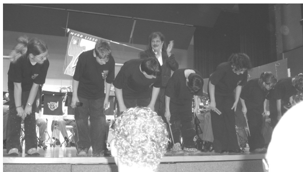
Die neuen Jungbläser beim ersten Auftritt