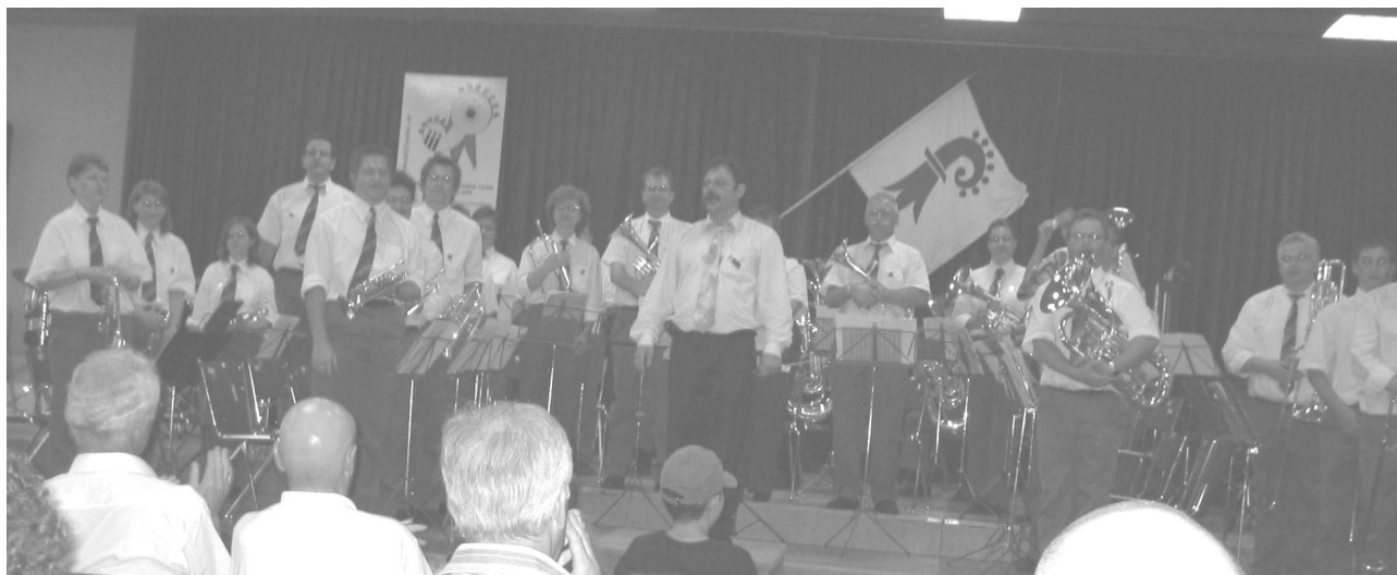
Gespannt warten wir auf unsere Punktzahl am Kantonalen Musikfest